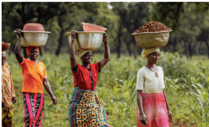
Des femmes du nord du Ghana ramassent des noix de karité avant de passer à l'étape de la transformation pour la création du beurre de karité